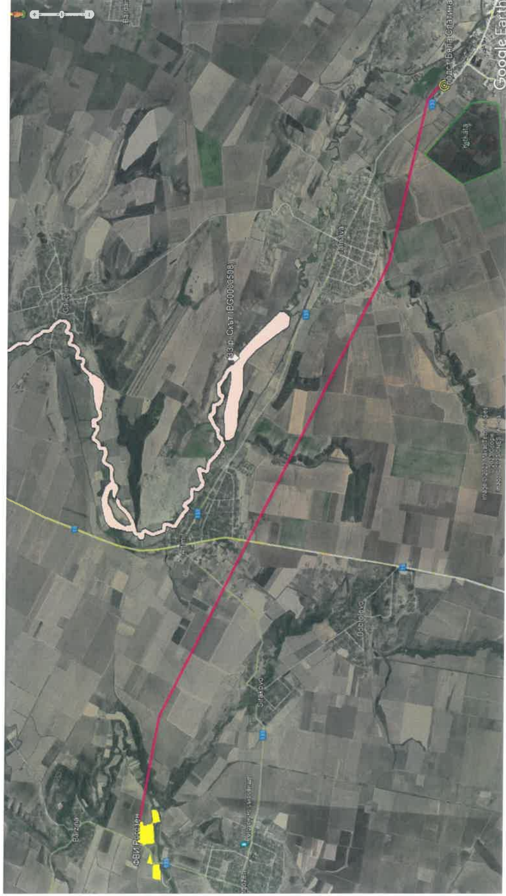
Фигура 1 Разположение на ИП

Инвестиционно предложение "Изграждане на електропровод 110 kV между ФВИ Рогозен, с. Рогозен, общ. Хайредин и електроподстанция „Бяла Слатина“ в землицето на гр. Бяла Слатина, област Враца"